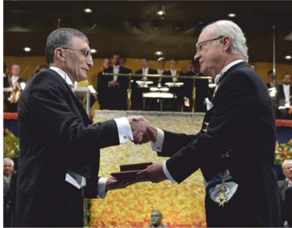
“BİLİM İNSANLIĞA OLAN BORCUMUZ”

Türkiye'de bilimin bizi Avrupa ve Amerika uygarlık düzeyine götüreceği tek yol olduğuna inanıyorum. Bunun bizim insanlığa olan borcumuz olduğu kanısındayım. Kendimize sormamız gerek; niçin penisilini veya cep telefonunu biz icat etmedik? Bu gibi katılımları yapmak hem memleketimize hem de insanlığa olan borcumuzdur. Hep dışarıdan gelen keşif ve icatlarla memleketimiz ne kalkınabilir ne de biz bir Amerika veya Batı Avrupalı özgüvenine sahip olabiliriz.